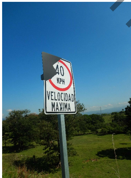
Figura 5. Vista de señal deteriorada.

Adicionalmente, se observó en el acceso demarcación vertical, y una en particular con deterioro como se muestra en la siguiente figura.