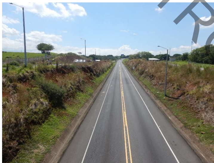
Figura 3. Vista panorámica de la RN 27 en colindancia de las estaciones.

En la siguiente fotografía, se puede apreciar el faltante de la demarcación horizontal sobre la ruta nacional en la colindancia de ambas estaciones.