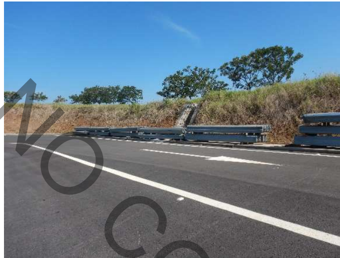
Figura 4. Vista de las barreras flex beam en sitio.

Adicionalmente, se observó en el acceso demarcación vertical, y una en particular con deterioro como se muestra en la siguiente figura.