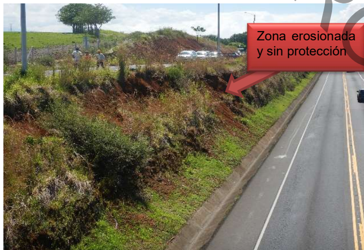
Figura 7. Figura 1

Adicionalmente, el talud colindante con la Ruta Nacional, ante la presencia de algunas cárcavas y suelo expuesto sin protección denota lo que podría ser algún indicio de inestabilidad del talud por lo que la Administración ha previsto se realice el análisis de estabilidad correspondiente.