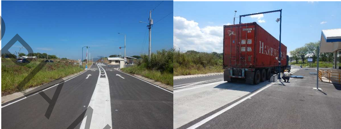
Figura 2. Estado de ambas estaciones de pesaje.

16 de mayo de 2023 AURA-10-2023-0003 (520) Página 4 de 8