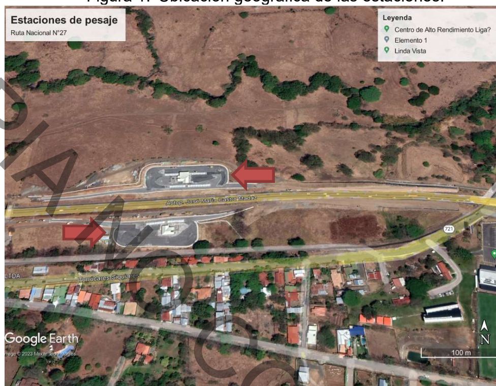
Figura 1. Ubicación geográfica de las estaciones.

16 de mayo de 2023 AURA-10-2023-0003 (520) Página 2 de 8