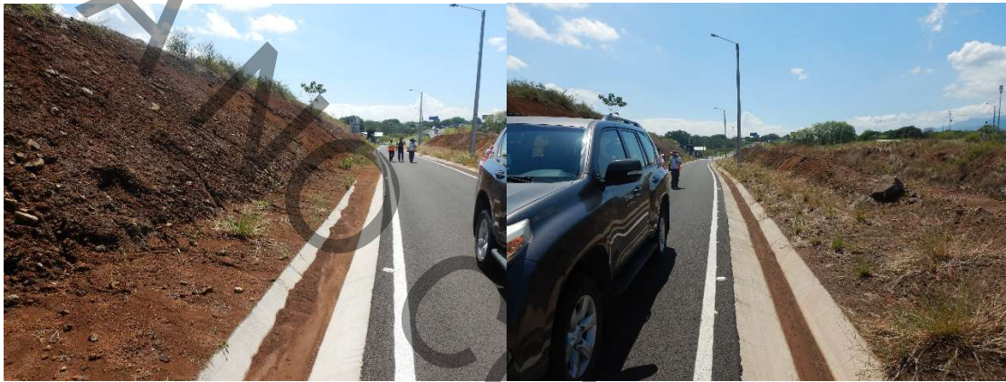
Figura 6. Vista de cuentas en salida de la estación.

Adicionalmente, el talud colindante con la Ruta Nacional, ante la presencia de algunas cárcavas y suelo expuesto sin protección denota lo que podría ser algún indicio de inestabilidad del talud por lo que la Administración ha previsto se realice el análisis de estabilidad correspondiente.