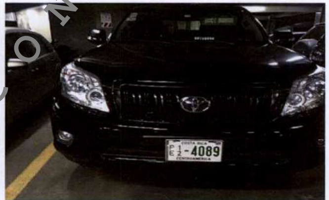
Fotografía tomada por la Dirección de Auditoría el 18/02/19.

Resalta necesario mencionar, que de acuerdo a lo establecido en el artículo 236 de la Ley de Tránsito "(...) Todos los vehículos del Estado, sus instituciones centralizadas y descentralizadas, deberán rotularse con los respectivos distintivos institucionales, de conformidad con lo que se establezca reglamentariamente, a excepción de los vehículos de uso discrecional, semidiscrecional(...) " a lo cual el ordinal 9 del Reglamento para el Servicio de Transportes del CONAVI 2 , agrega que "(...) Todos los vehículos del CONAVI, deberán llevar el emblema del CONAVI, "USO OFICIAL" en las puertas delanteras y usar placa oficial (...) ". (La Negrita no pertenece al original).