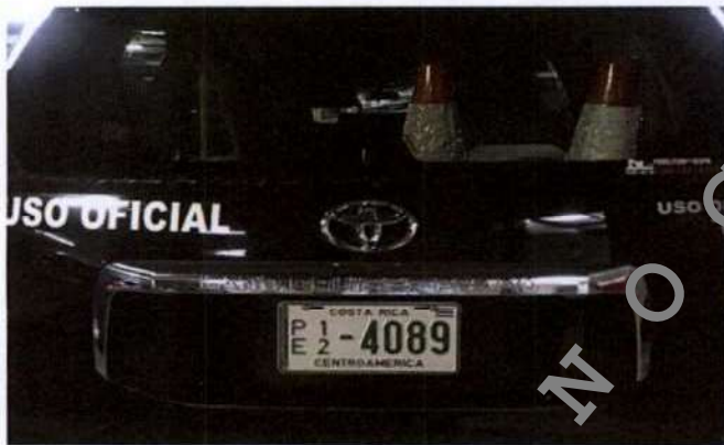
Fotografía tomada por la Dirección de Auditoría el 18/02/19.