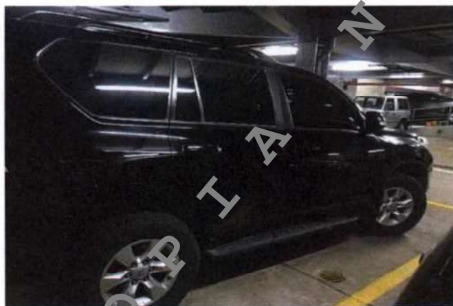
Fotografía tomada por la Dirección de Auditoría el 18/02/19