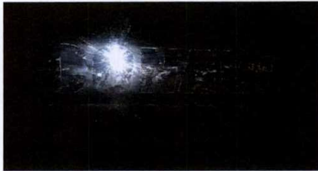
Fotografía tomada por la Dirección de Auditoría el 18/02/19.