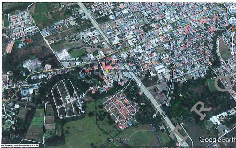
Figura 3: Ubicación satelital de oficina del Administrador Vial, zona 2-1, Liberia.

La oficina se ubica aproximadamente cien metros al sureste de la agencia Scotiabank, situado en el centro comercial Plaza Santa Rosa.