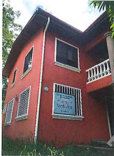
Fotografía 1: Vista general de la oficina del administrador vial en la zona 2-4. Fuente: Auditoría Interna, mayo 2018.

El inmueble habilitado como oficina, tal y como se puede observar en la fotografía 1 es una estructura de dos plantas construida en bloc y concreto estructural.