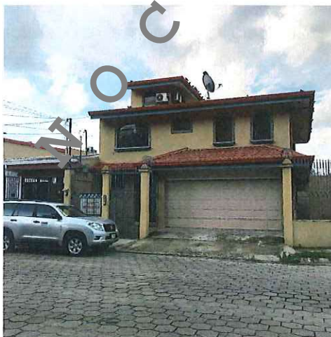
Fotografía 3: Vista frontal de la oficina del Administrador Vial en la zona 2-1, Liberia.

El inmueble destinado para oficina, externamente es una propiedad de dos plantas, tal y como se puede observar en la siguiente fotografía.