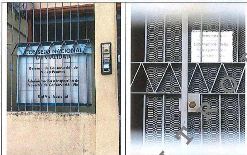
Fotografía 4: Imágenes de la rotulación externa en la oficina del Administrador Vial de la zona 2-1, Liberia. Fuente: Auditoría Interna, mayo 2018.

tamaño carta se exponen varios números telefónicos, pero en ninguno se logra establecer comunicación a las 16:50 horas.