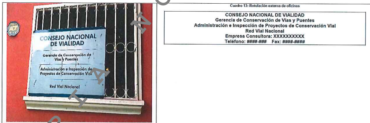
Figura 2: Imágenes de rotulación en campo versus especificaciones.

Como se puede observar, la oficina se encuentra rotulada, no obstante, el mismo no cuenta con la totalidad de información requerida a nivel de especificaciones según el cuadro 13, no se incorpora la información relacionada propiamente con la empresa consultora, su nombre, número telefónico y número de fax.